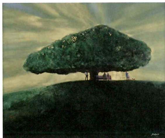
《丘の上の大樹》1991年 大分県立美術館