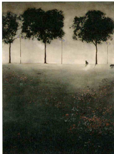
《犬のいる風景》1941年 大分県立美術館