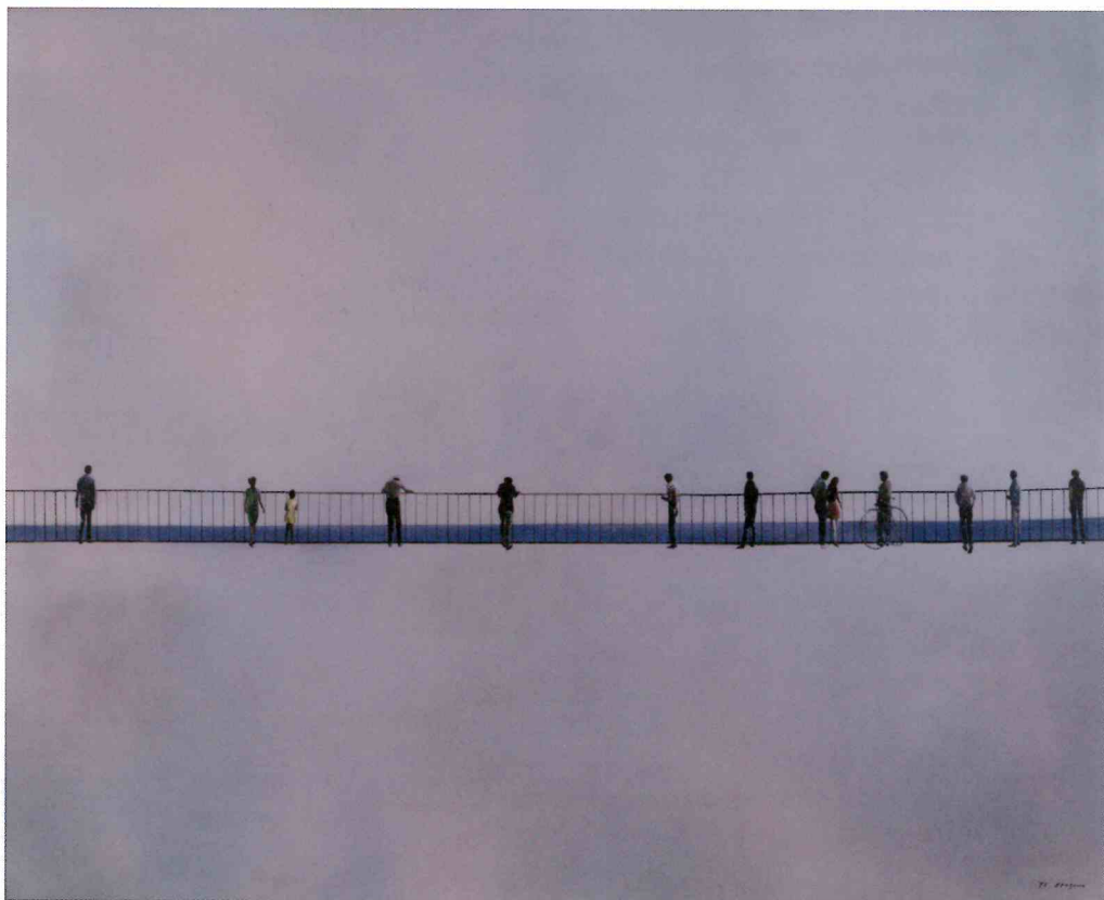
《空と水と地と人と》1970年（寄託品）

2021年 9月18日(土) ≫ 10月31日(日) 大分県立美術館 3階 コレクション展示室