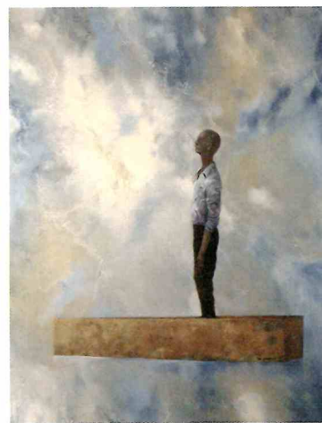
《ひとり》1970年 東京国立近代美術館